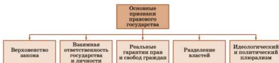
Схема 18. Основные признаки правового государства

2. Взаимная ответственность государства и личности. В правовом государстве не только граждане несут ответственность перед государством, но и государство несет ответственность перед гражданами. Ответственность личности перед государством строится на правовых началах. Применение государственного принуждения должно носить правовой характер и соответствовать тяжести правонарушения. Ответственность государства проявляется в ответственности отдельных его органов и должностных лиц. Это, например, ответственность правительства перед парламентом, депутатов перед избирателями, юридическая (дисциплинарная, уголовная и др.) ответственность должностных лиц и т. д.